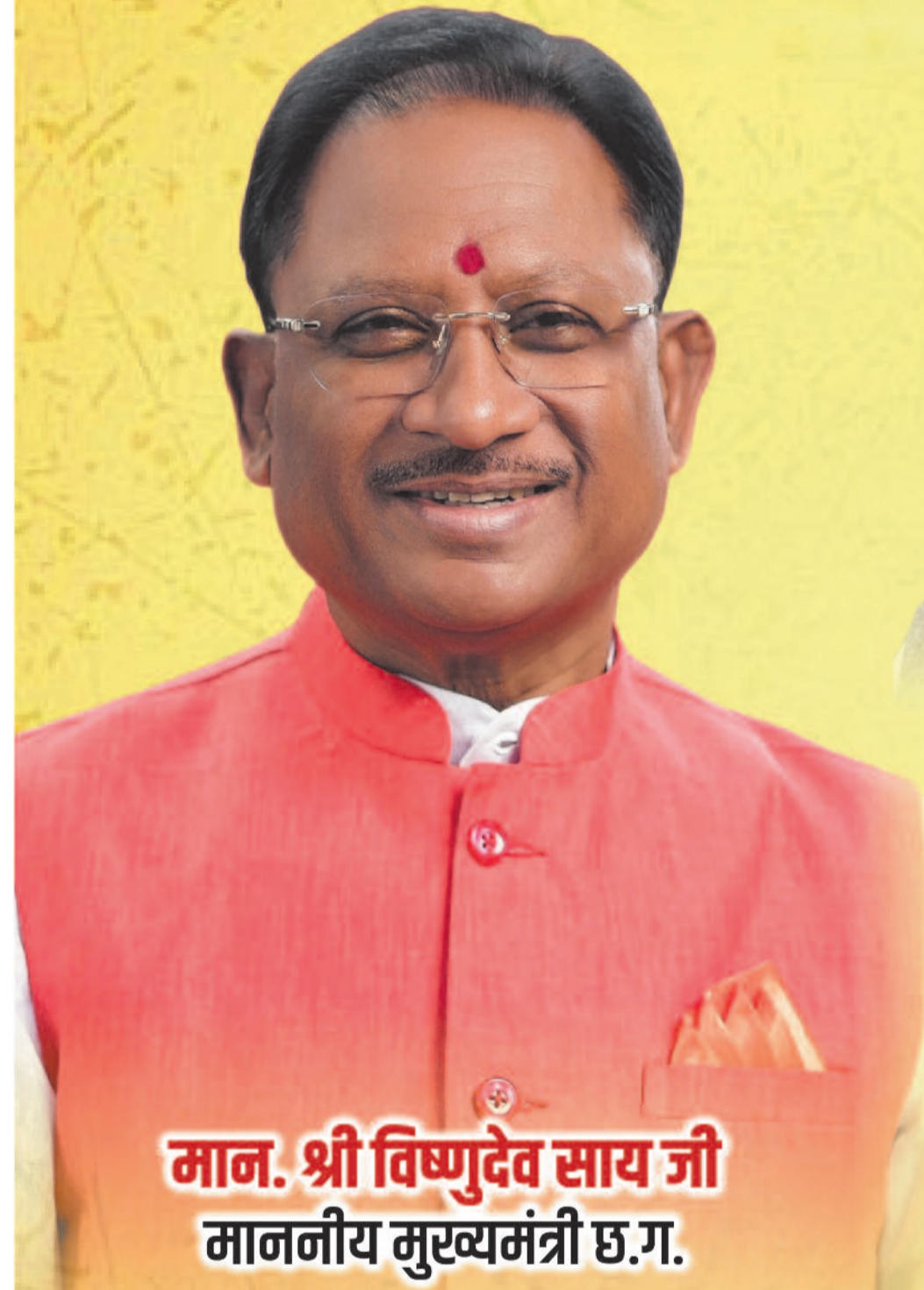
मान. श्री विष्णुदेव साय जी माननीय मुख्यमंत्री छ.ग.